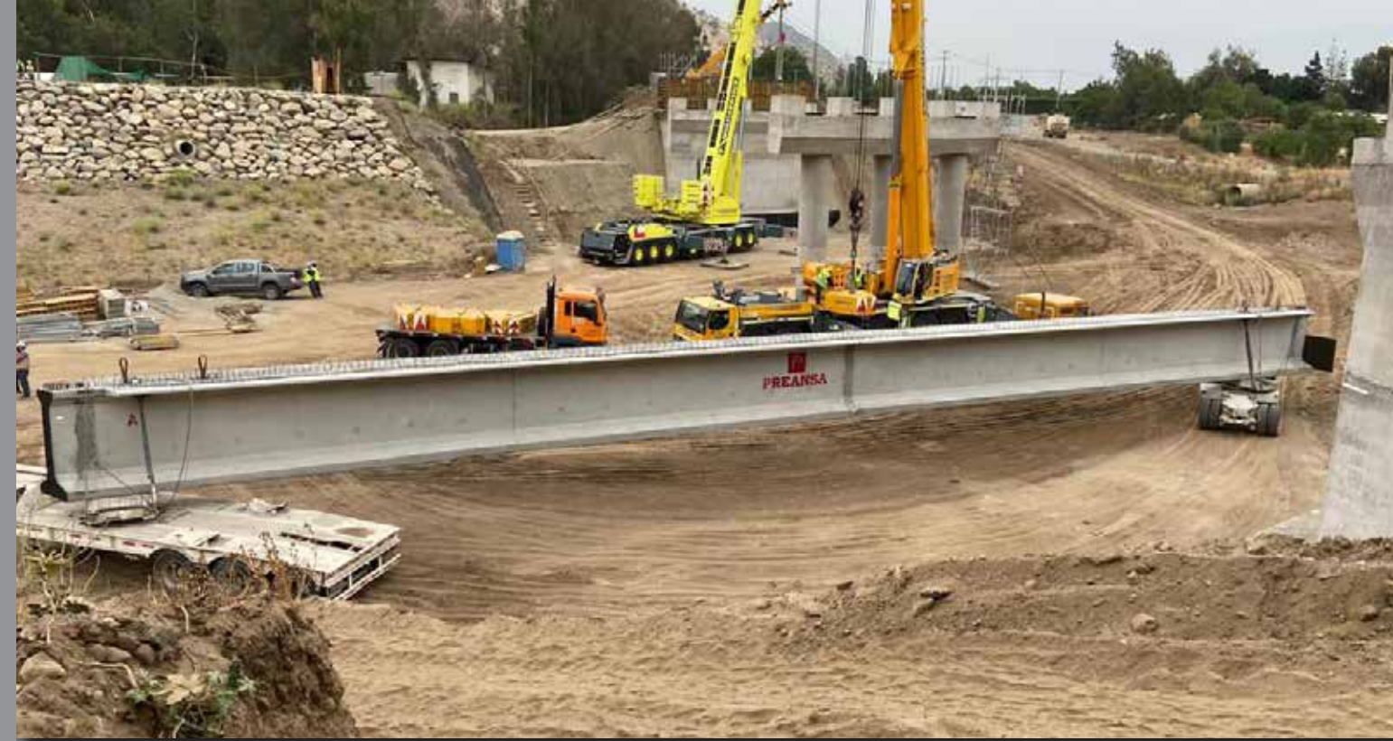
Puente Lampa, Ruta G - 150, RM.