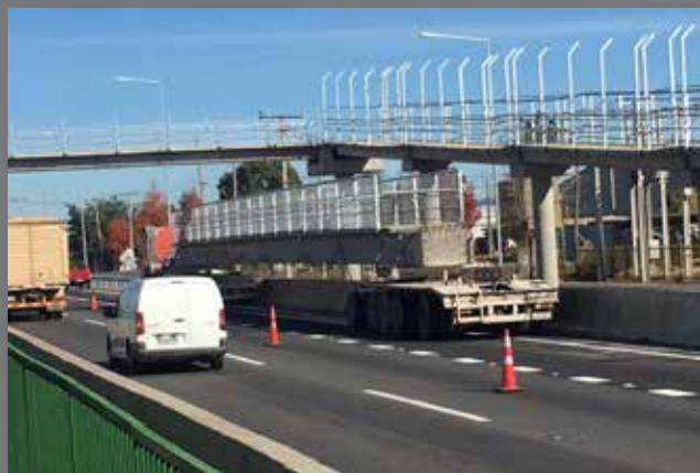
Pasarela Ruta 5 Sur, VI Región