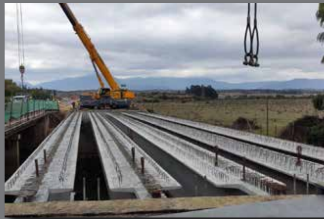
Puente Estero Puchuncavi, Ruta F - 20 Quillota, V Región