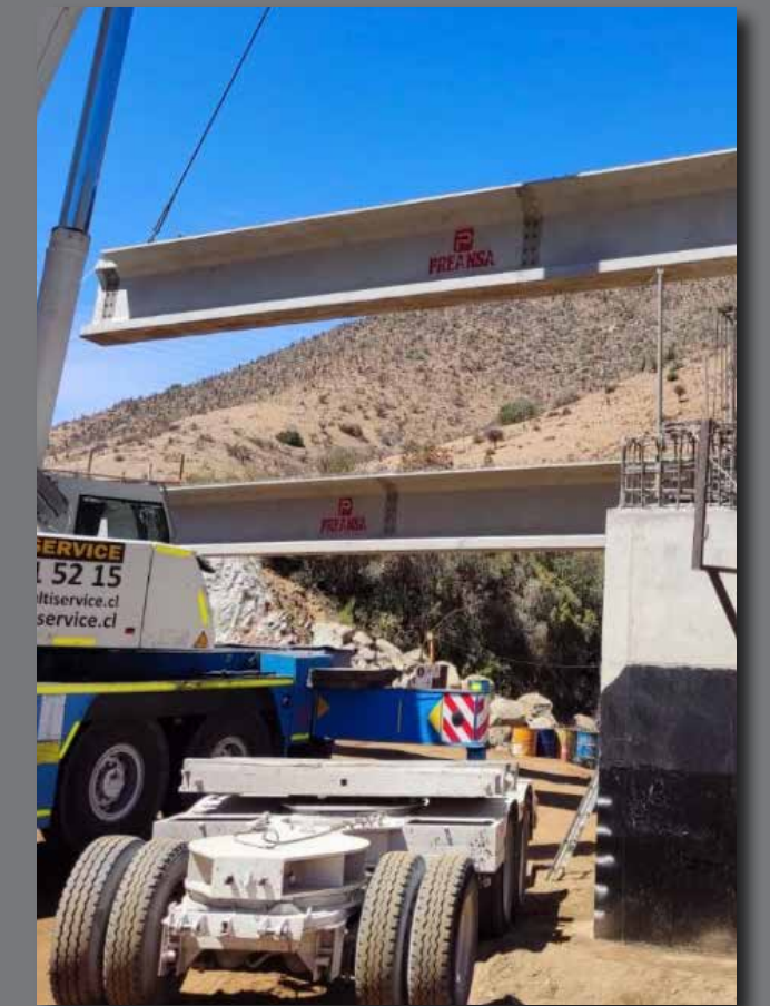
Puente El Escorial, Ruta G - 16, Chacabuco