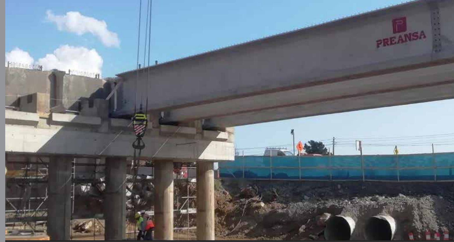
Puente Limache V Región