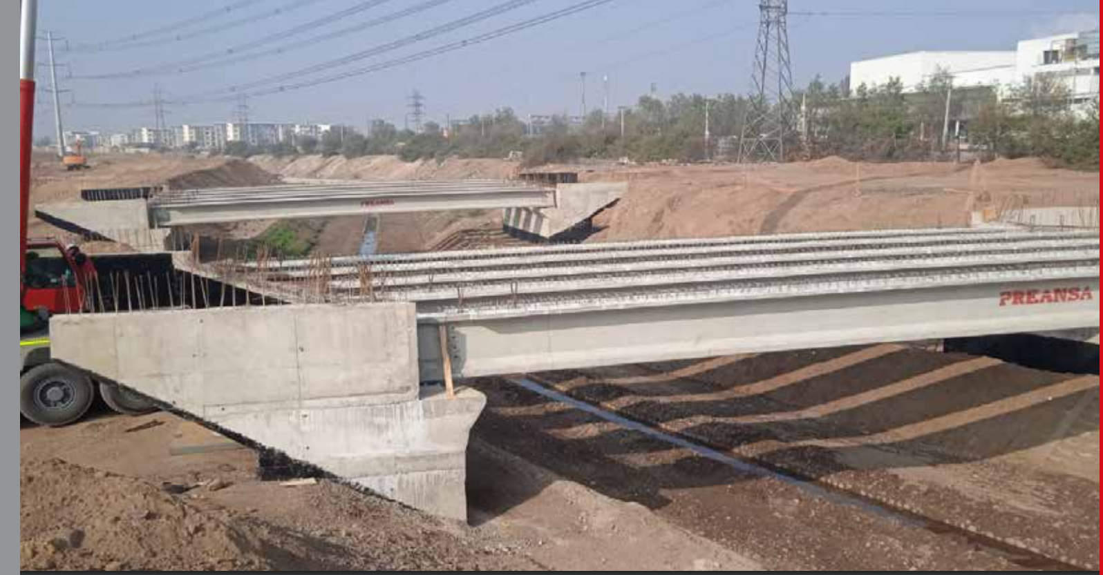
Puente Santa Elvira, Pudahuel, RM.