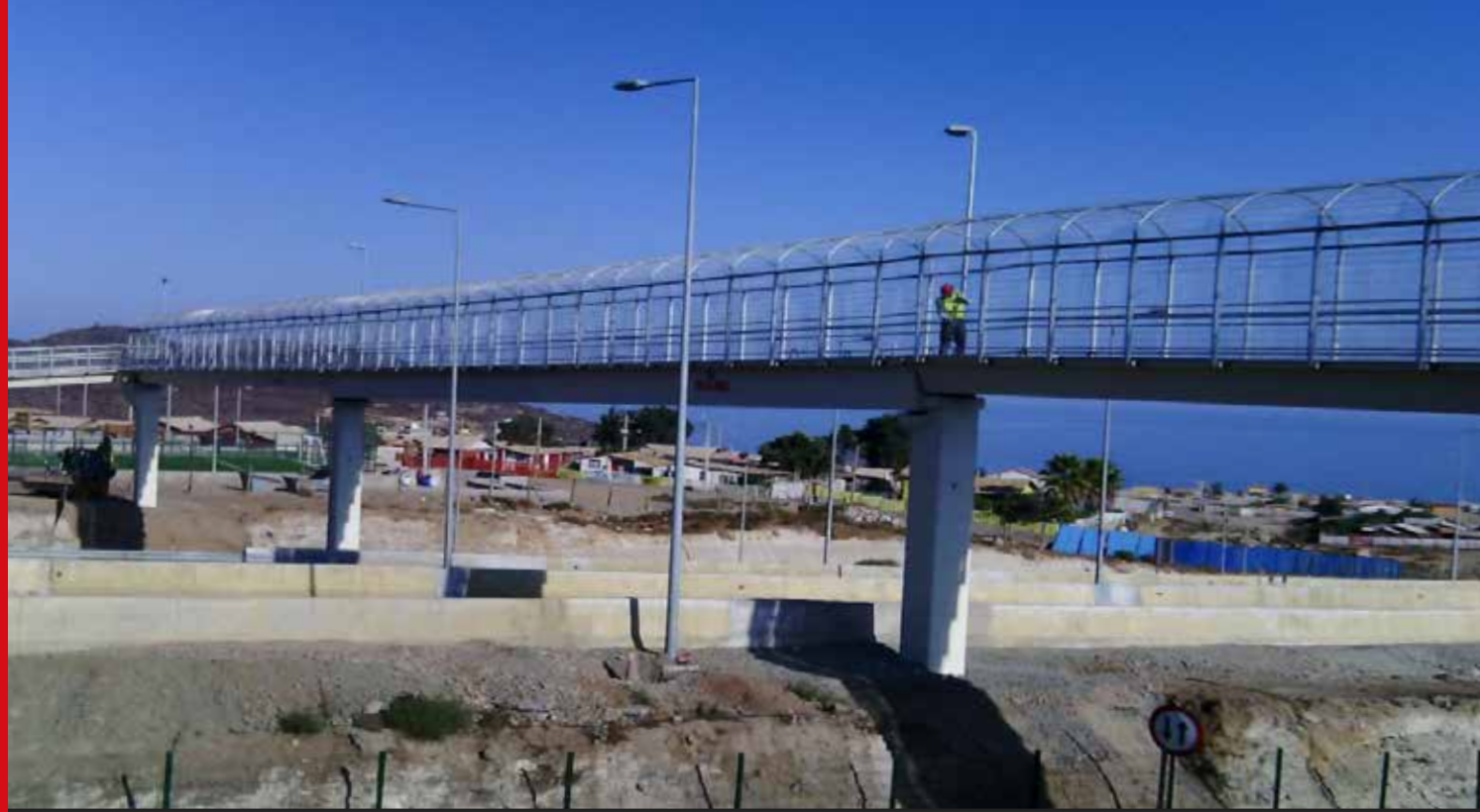
Pasarela Caleta Hornos, Ruta Serena - Vallenar