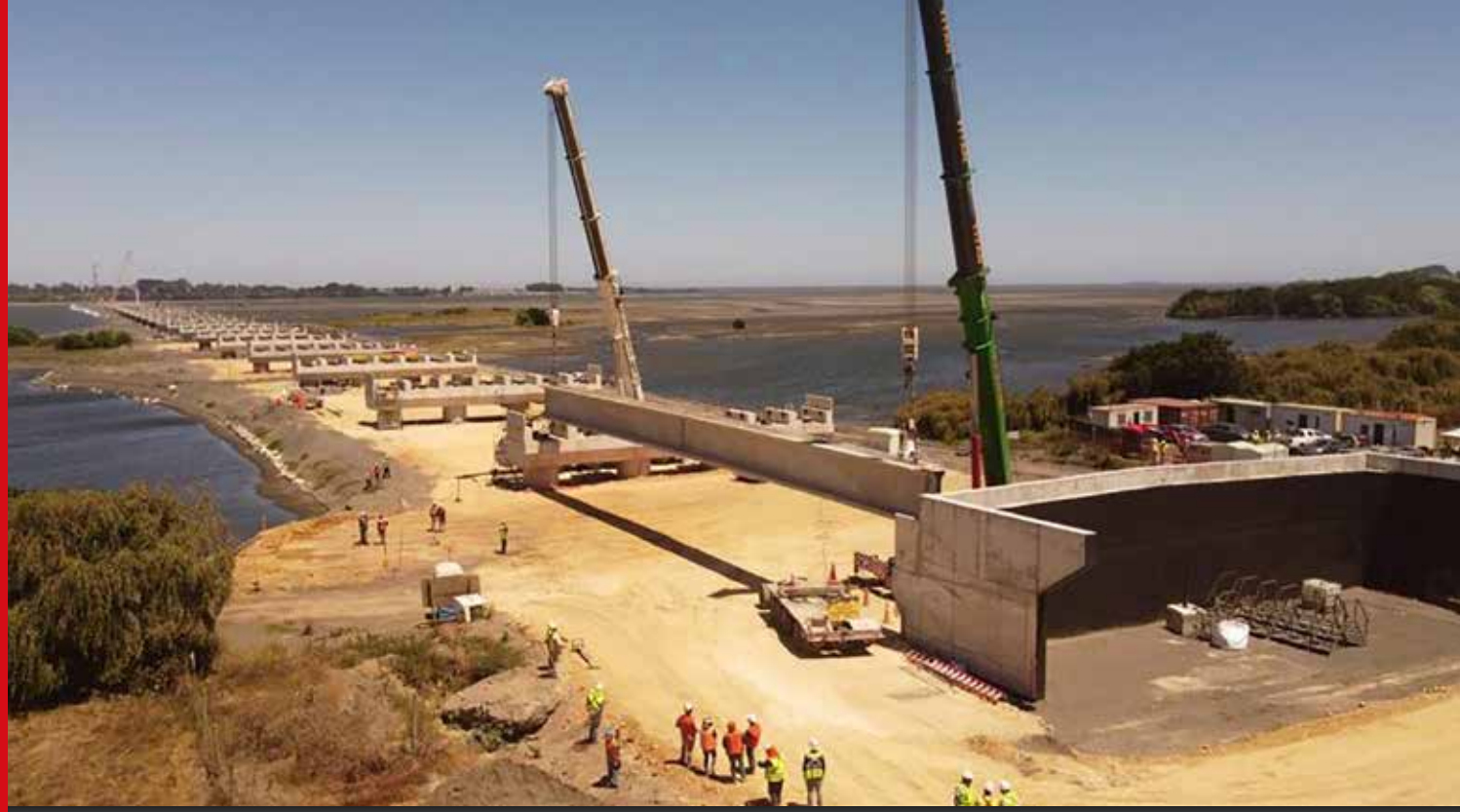
Puente Industrial VIII Región