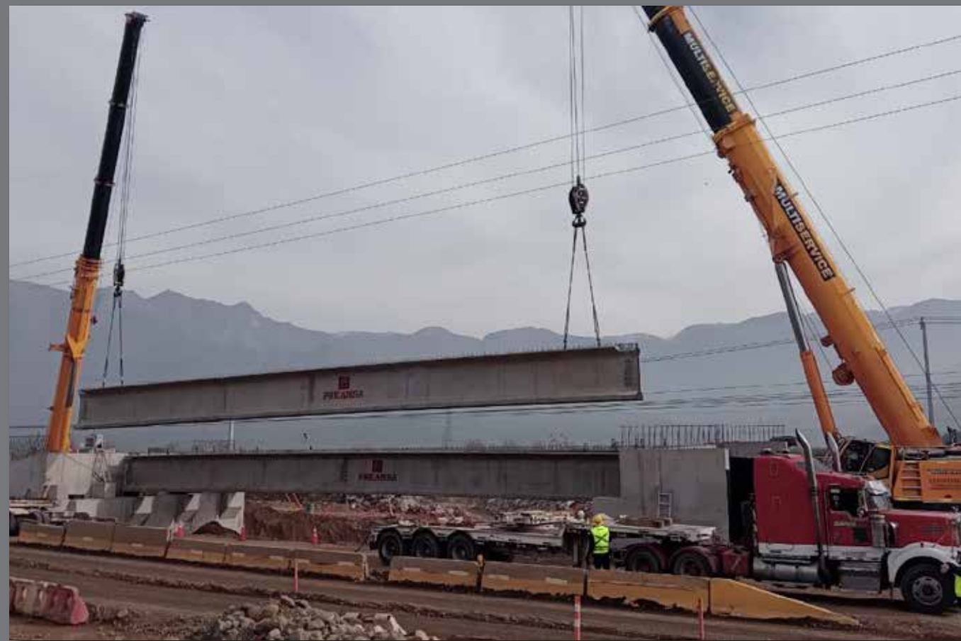
Puente Ventarrón Ruta G - 16, Til Til, RM.