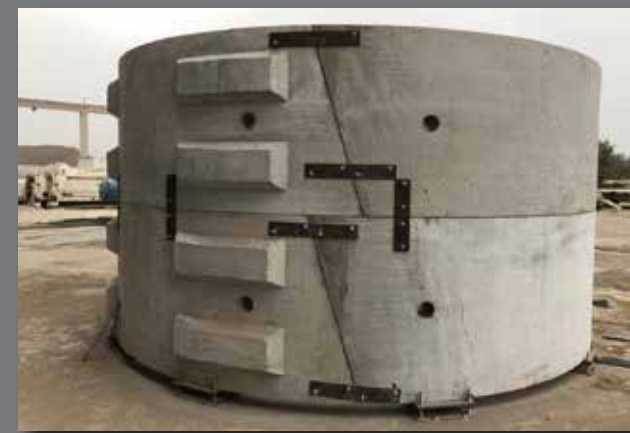
Dovela Alto Maipo