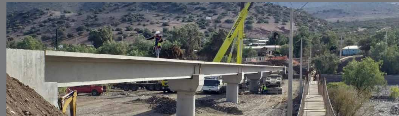
Pasarela Los Comunes, Chincolco, V Región