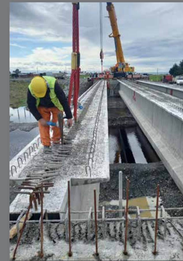
Puente Estero Puchuncavi