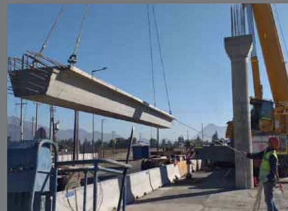
Pasarela 3ra Pista Ruta 5, RM.