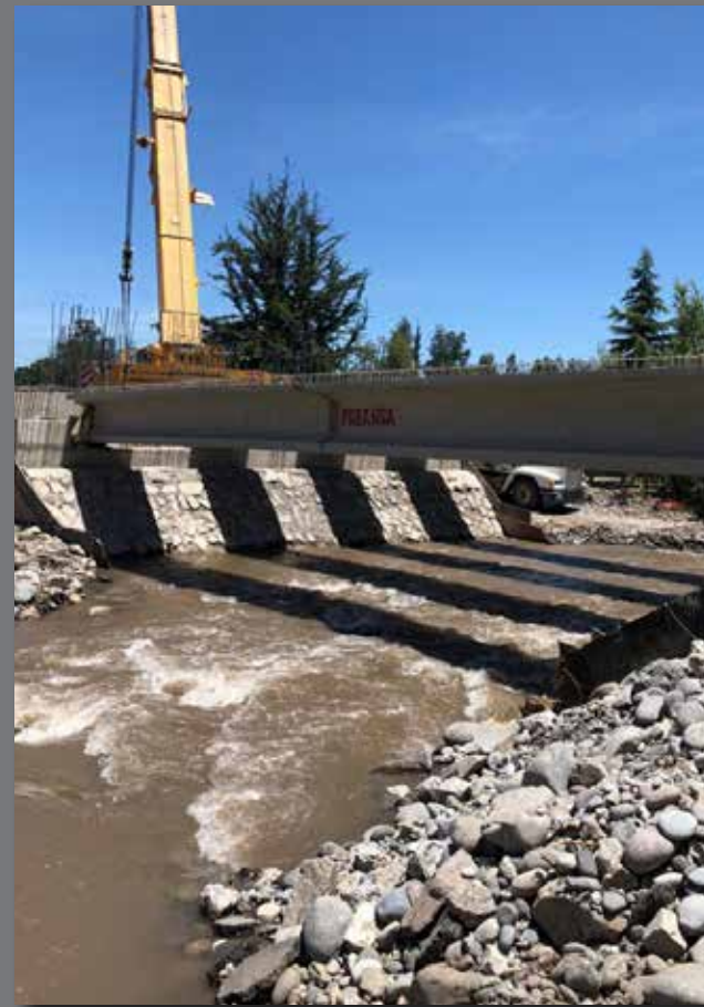
Puente José Palena, X Región